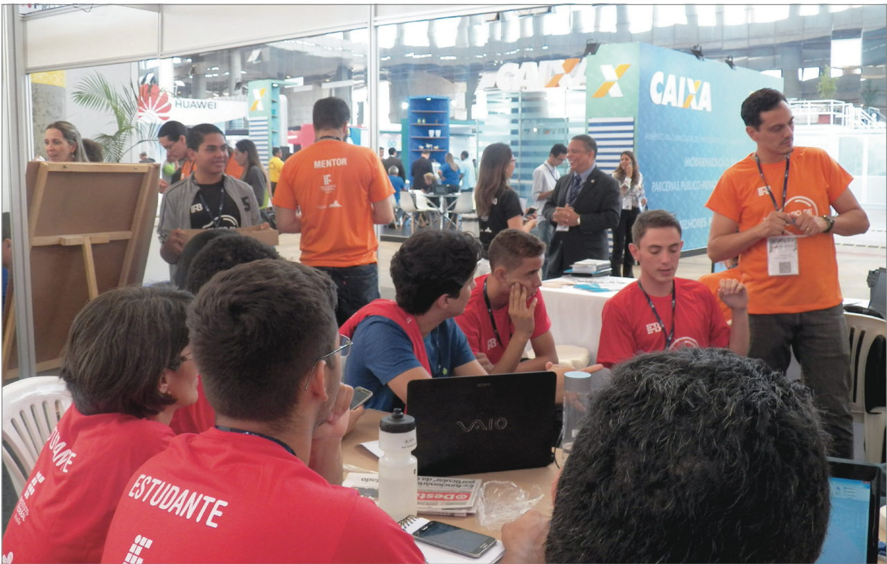
Equipes trabalhando na solução de problemas

Do ponto de vista do aprendizado, os resultados do Desafio de Projetos são imediatos e mostram como é possível desenvolver habilidades e competências para fora das quatro paredes da sala de aula, para além do que está estabelecido na “grade curricular”. No Desafio de Projetos não há paredes, a circulação é livre, e o conhecimento é compartilhado entre todos. Ao final dessa terceira edição, as principais frases faladas foram “Quando vai ter o próximo Desafio?” e “Quando tiver o próximo, por favor me convidem. Eu quero participar”.