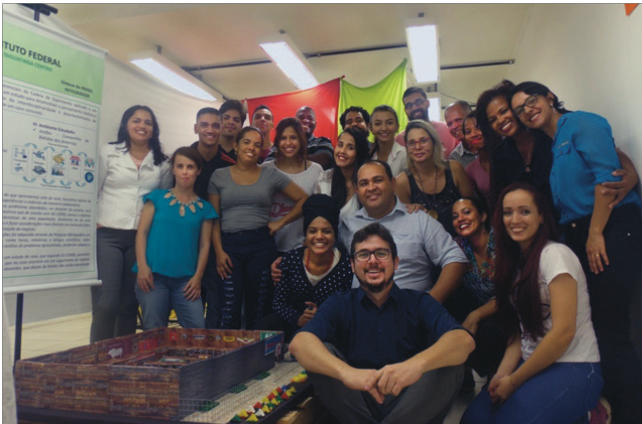
Equipe Reunida no Encerramento das Atividades

orientadores tiveram que participar para fazer a sua avaliação, mediante os indicadores supracitados. A exposição do projeto ocorreu no Campus Taguatinga Centro, no dia 13 Junho de 2017, na sala 05.