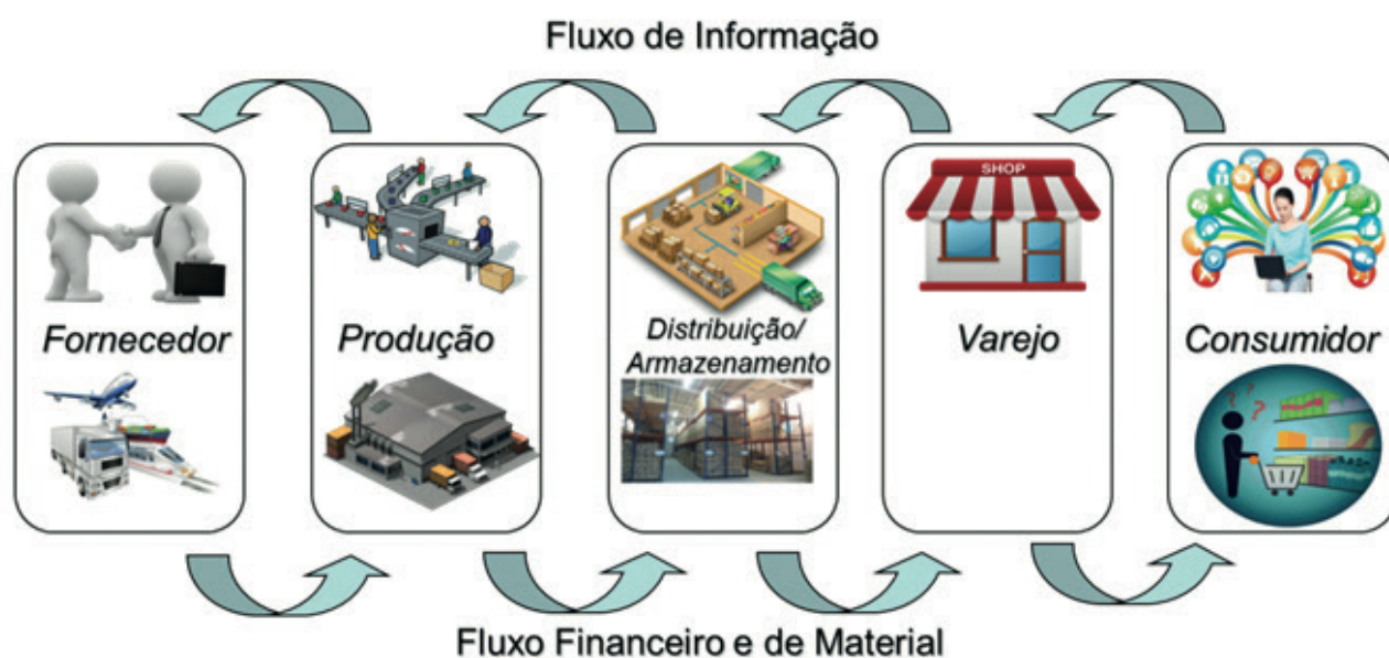
Cadeia de Suprimento Atribuída ao Tema

A prática foi da turma do 2º Período de Processos Gerenciais, que teve como meta construir toda a exposição. No entanto, para melhor divisão do trabalho, a cadeia de suprimentos, que está demonstrada na figura 01, teve seus grupos divididos em três equipes, contemplando no máximo 9 (nove) alunos em cada um.